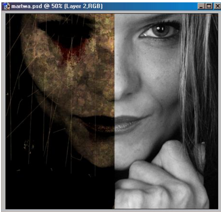
3] Turpizm (esencja cyfrowa2)