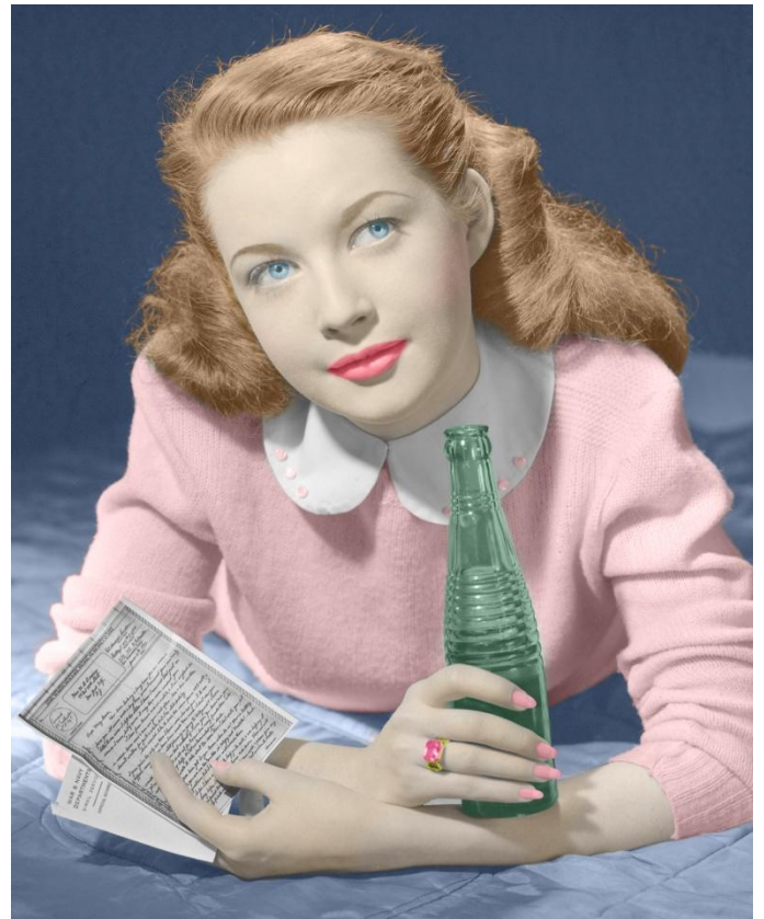
Kolorowanie zdjęć cz-b