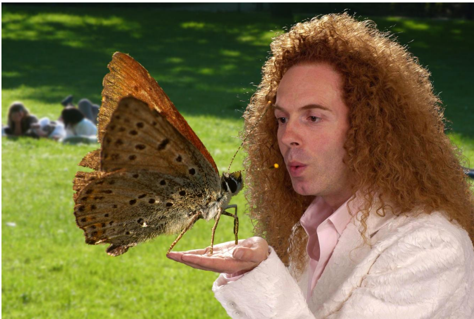
Wycinanie postaci (powyżej fotomontaż składający się z obiektów różnych zdjęć – motyl, tło, mężczyzna)